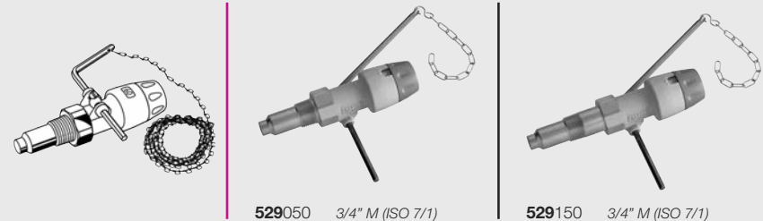
529050 3/4" M (ISO 7/1)